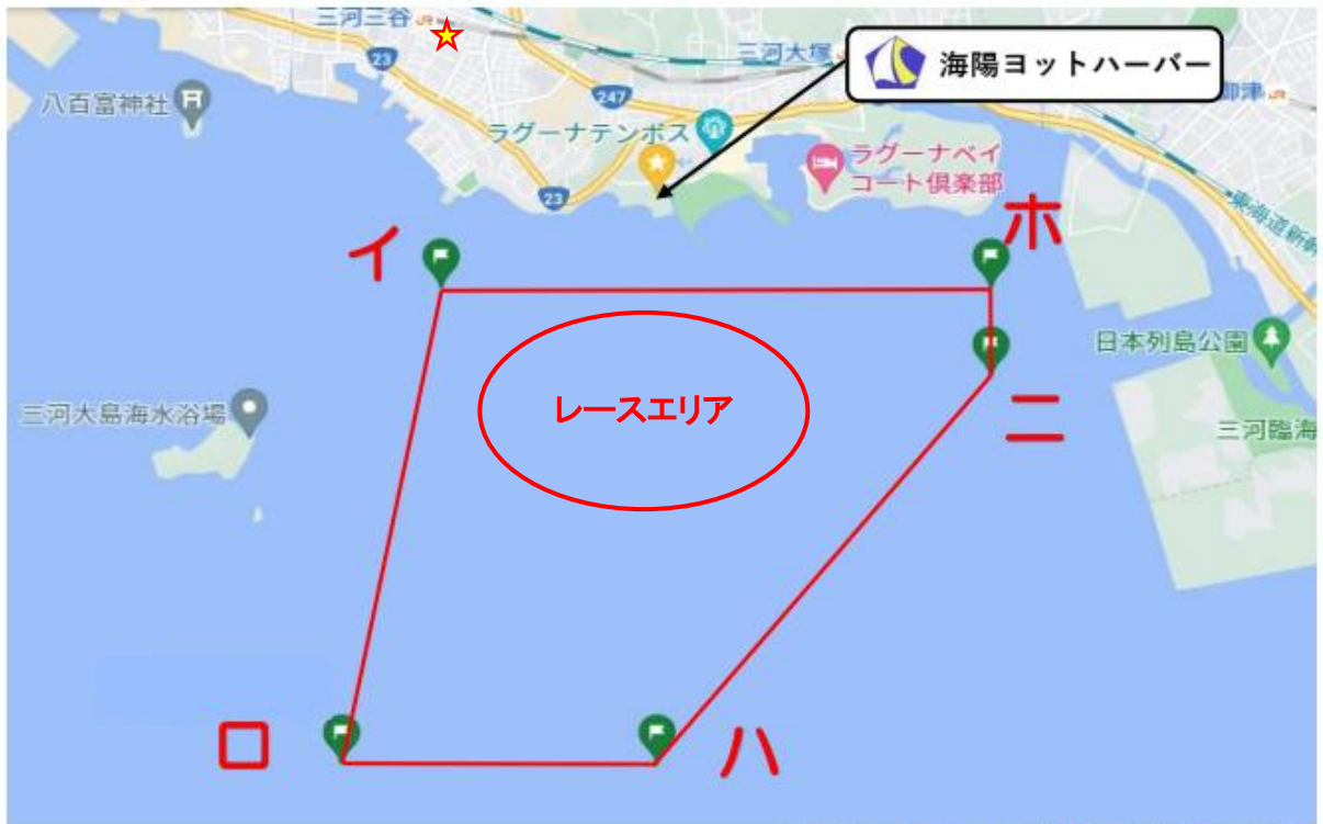
【添付図A】 「レース・エリア」